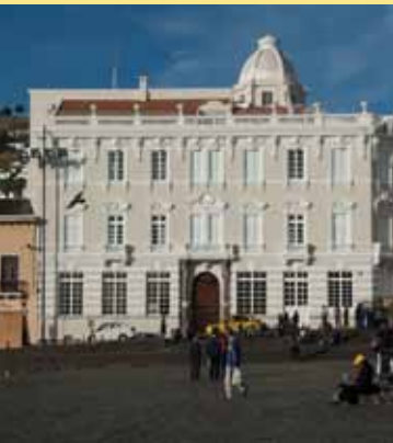
La mansión restaurada, que ahora es un hotel de lujo: Casa Gangotena.