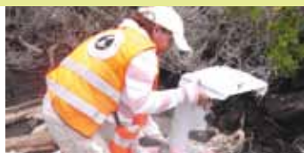
Fundación Galápagos-Ecuador siempre está en los temas de limpieza costera.