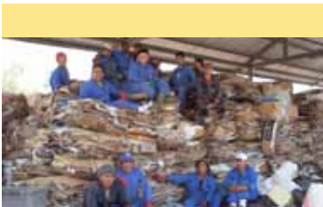
Personal del Parque Ambiental Fabricio Valverde en la isla Santa Cruz