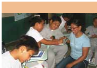
Talleres de trabajo con niños de la Isla Floreana.