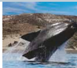
Alfonsina, la ballena adoptada por MT Argentina.