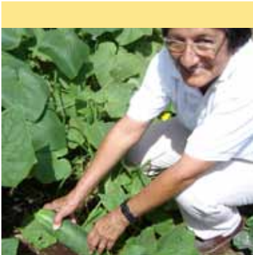
La huerta en el Finch Bay Eco Hotel.