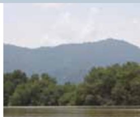
Reserva Manglares Churute.