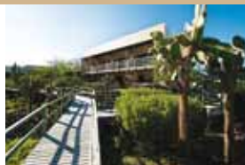
Eco Hotel Finch Bay