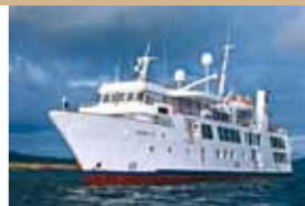
Yate Isabela II