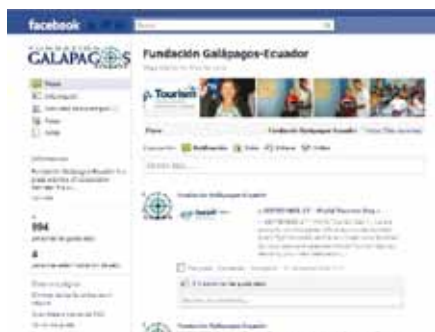
"Fan page" de Facebook de Fundación Galápagos-Ecuador.