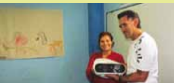
Donación a la Fundación Nueva Era Galápagos