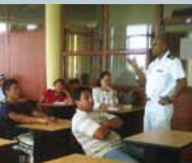
Los operadores de lanchas de la Isla Santa Cruz fueron entrenados sobre el daño que causa el depósito de aceite en contenedores en mal estado y derramarlos en el mar.