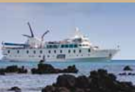
Yate La Pinta