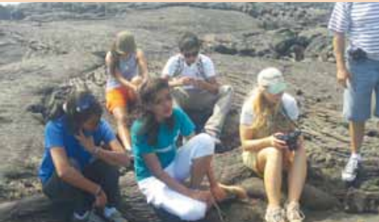
Más de 40 estudiantes y ocho maestros han estado a bordo de la M/N Santa Cruz en el último año.