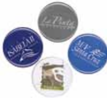
1,418 pines han sido re-utilizados.