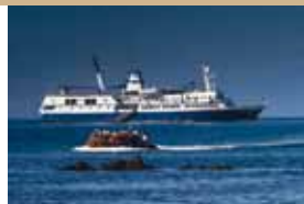
M/N Santa Cruz