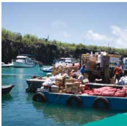
Carga de basura en un barco en Galápagos.

www.facebook.com/MetropolitanTouring www.metropolitantouring.com info@metropolitan-touring.com twitter.com/metrotouring