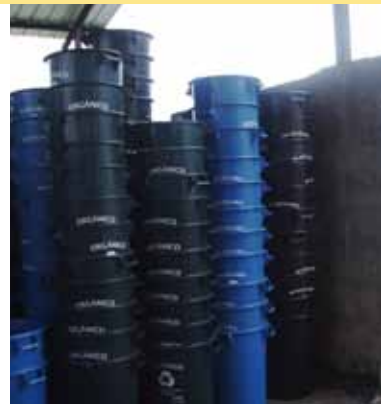
Nueva planta de reciclaje de la Isla Isabela.