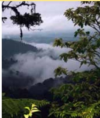
La Reserva de Biodiversidad de bosque montañoso lluvioso Mashpi