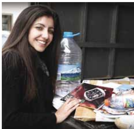
Día Mundial del Medio Ambiente en nuestras oficinas en Quito.