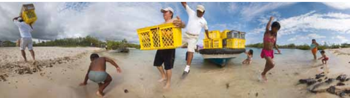
Limpieza costera en Galápagos.

Este año, hemos visto el trabajo de la Fundación Galápagos-Ecuador expandirse a nuevos proyectos en las Islas. Trabajando en conjunto con organizaciones gubernamentales locales y otras agencias, en la actualidad contribuimos a proyectos en las 4 islas habitadas. En el área continental de Ecuador, el nuevo hotel de nuestro holding y el nuevo lodge en el bosque montañoso lluvioso de los Andes, han adoptado un diseño inteligente y alojamiento responsable en el país. Y en los 6 países donde operamos, tenemos un impacto positivo y estamos dando grandes pasos para ser más responsables cuando se trata del uso de un recurso natural.