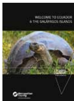
Libro de bienvenida Metropolitan Touring.