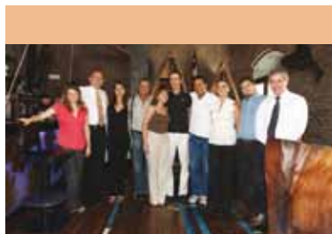
MT Chile, la Fundación Cousteau y el Gobierno de Chile, realizó un seminario de educación.