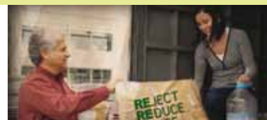
Reciclaje de diferentes materiales en nuestras oficinas en Quito.