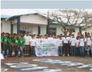
Día Internacional de la Limpieza Costera celebrado el 17 de septiembre.

programas y proyectos que brinden apoyo al desarrollo social y a la protección ambiental de las áreas donde operamos.