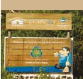
Centro de Interpretación dentro del Centro de Reciclaje Fabricio Valverde en la Isla Santa Cruz.