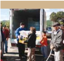
Estufas de Kerosene entregadas al pequeño pueblo de Bucalemu en Chile.