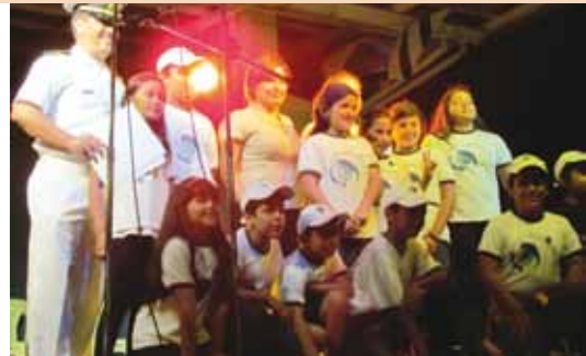
Grupo “Guardianes del Mar”.